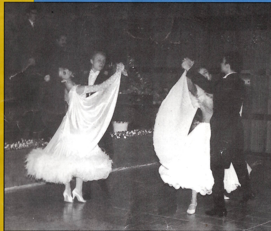
Tanečná škola Jager-majster Ples podnikateľov 3. 2. 1996 KS Račan

Z OBSAHU: • IX. ZASADNUTIE MZ RAČA • PREDAJ BYTOV DO VLASTNÍCTVA • ZÁPIS DETÍ DO MŠ • RODÁČKA Z RAČE PÍŠE •