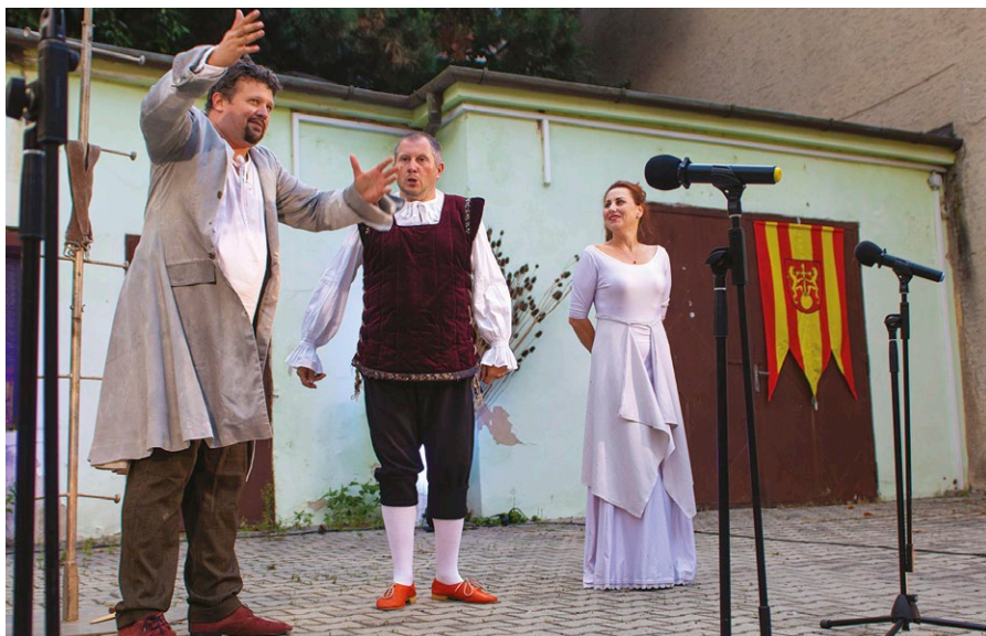
Divadelné predstavenia oživilo nádvorie Koloničovej kúrie