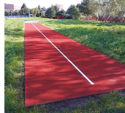
Nové doskočisko na Tbiliskej

Denný stacionár na Plickovej 1. októbra tento rok doviedol svojich 5 úspešných rokov. Projekt račianskeho stacio-