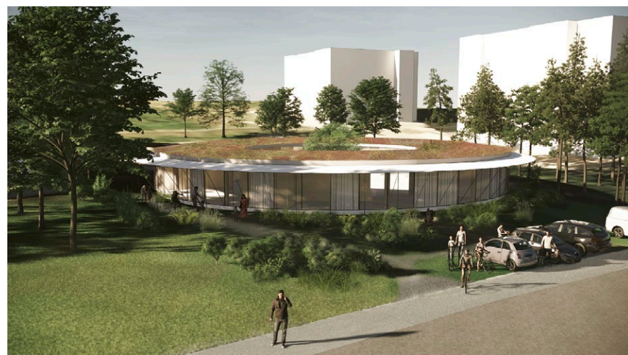
Projekt novej materskej školy Tramin (Pantograph)

Dôležitou výzvou bude opäť téma adaptácie našej mestskej časti na zmenu klímy, do ktorej by som zahrnul ďalší rozvoj našich kvitnúcich záhonov, vybudovanie novej cyklotrasy pri Depe Krasňany, alebo lepšia práca s vodou na našich sídliskách.