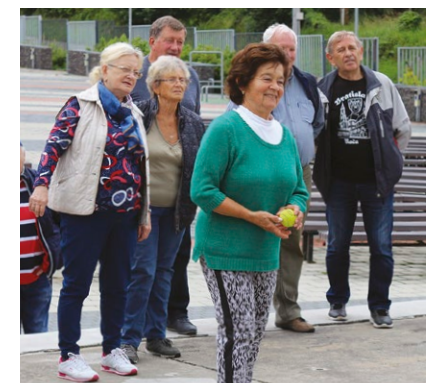
Olympiáda seniorov, leto 2020

Tento rok bol veľmi netradičný. V podstate sme sa v DCS schádzali len počas januára a februára. Od 6. marca tes-