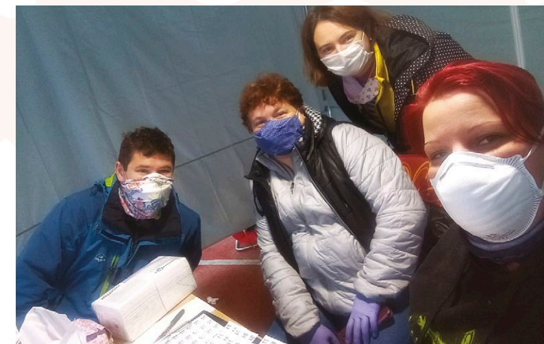
Ďakujeme dobrovoľníkom, ktorí ochotne pomáhali. Mnohí Račania, ktorí sa prišli otestovať chválili ich prístup, ochotu a ľudskosť. Ďakujeme, bez vás by sme to nedali.