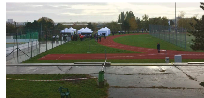
Najväčšie odberné miesto bolo na Tbilisej, kde boli tri exteriérové a tri interiérové stanovišťa. Rady sa hýbali svižne.

Račania opäť raz ukázali, že sú silnou komunitou, ktorá sa v náročných časoch dokáže zomknúť a navzájom si pomôcť. ■