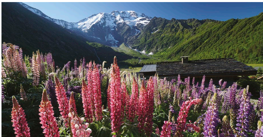
Tour de blanc (Švajčiarsko)