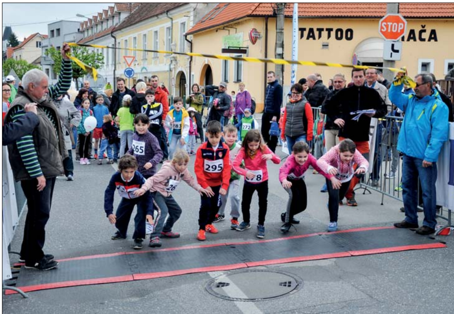
Úspech mali aj populárne detské behy.