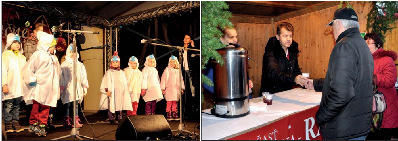
Aj keď počasie neprialo, naši škôlkari a školáci predviedli krásny program. Starosta nalieval starostovský čaj a punč.