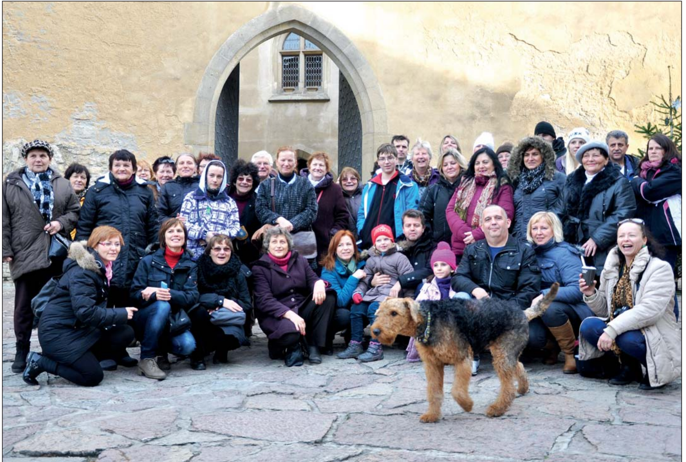
Najprv Račania navštívili Prahu, potom aj Karlštejn, kde sa s nimi odfotoil aj hradný pes.