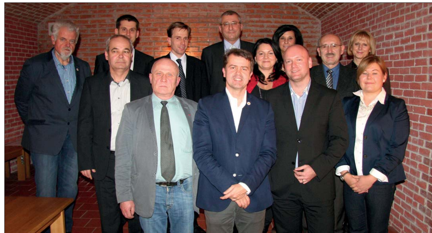
Starosta pripravil pre nových poslancov priateľské posedenie v pivnici Obecného domu.