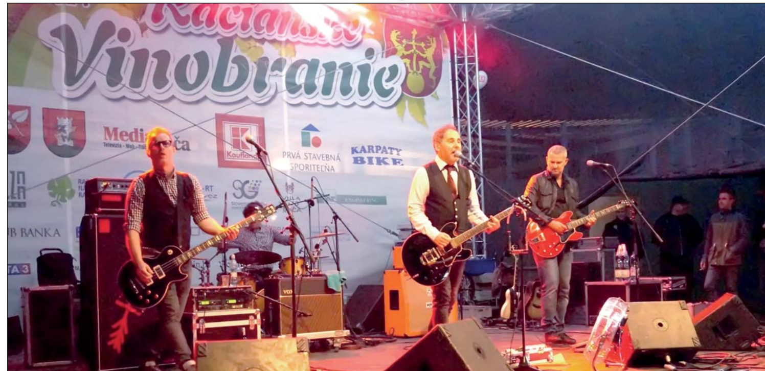
HEX na pódiu v amfiteátri odspieval svoje najväčšie hity.