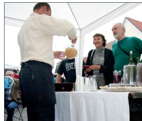
V uliciach nechýbali stánky s dobrým račianskym burčiacom.