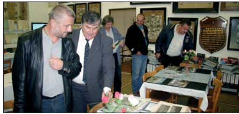
Aj Pamätná sieň M. R. Štefánika inšpirovala zahraničnú návštevu.