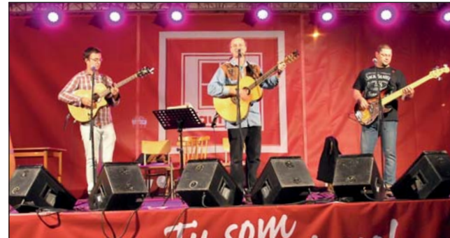
Vďaka štrednému sponzorovi sa marketingovému oddeleniu podarilo zorganizovať pódium a program na Nám. A. Hlinku.