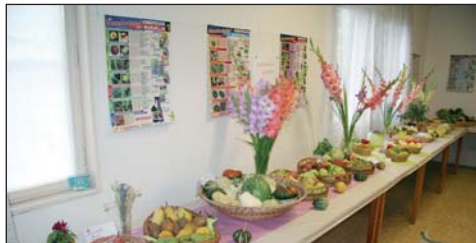
Nechýbala ani výstava záhradkárov.