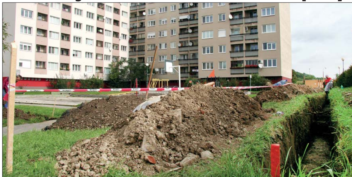
Prvé výkopové práce pre polozenie káblov na nové verejné osvetlenie boli vykonané koncom septembra.

Vysadia tu tiež ovocné kvitnúcce stromy, krovité rastliny a vinič popínajúci sa po navrhovanej pergole a opore pre vinič. Opravu potrebuje aj verejné osvetlenie