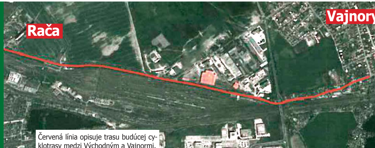
Červená línia opisuje trasu budúcej cyklotrasy medzi Východným a Vajnormi.