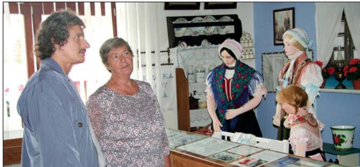
Račianska izba sa zapáčila našim priateľom zo Starého Mesta pod Landštejnem.