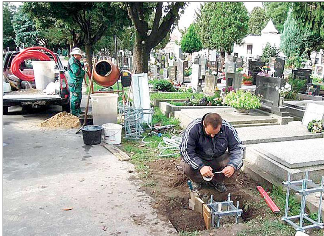
Ak pôjde práce podľa plánu, osvetlenie už bude fungovať na tohtoročný Sviatok všetkých svätých.