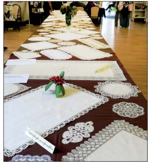
Čipkárky vystavovali v NKD. Klub zároveň oslávil 40 rokov fungovania.