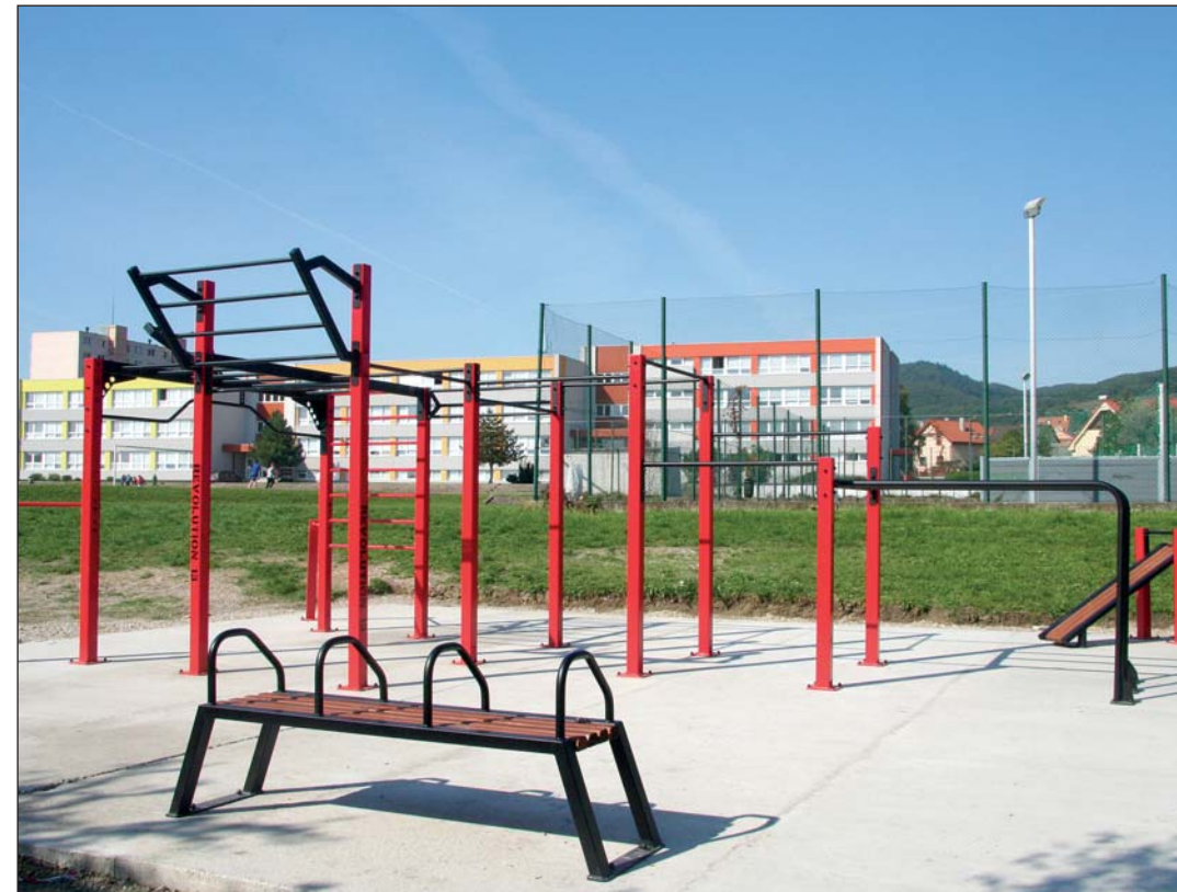
Ihrisko sa vybuďovalo aj vďaka dobrovoľníkom, ktorí tu odpracovali desiatky hodín.