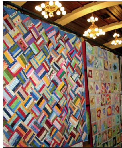
Dámy z Patchworkárskeho cechu inšpirovali prácami veľa návštevníkov.

► si našiel niečo, čím sa u nás inšpiroval: Česi vyslovili uznanie, že expozície Račianska izba a spolku Vyslúžilých vojakov je na špičkovej úrovni. Poliari hľadali nad pivnicami a pokladmi Villa Vino Rača a páčili sa im diela umelcov z Art Villa Rača. Najmä delegácii z Morawice sa páčil bohatý a dobre zvládnutý kultúrny program na viacerých pódiumoch, srdečná atmosféra krsťu knihy, aj oficiálne otvorenie,