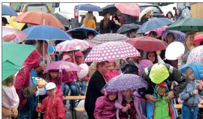
Dáždnik a gumáky boli počas vinobrania nutnosťou.

► dé a atraktívne pop speváčky z poľskej Morawice. Staré Mesto pod Landštejnem zasa hviezdišlo v amfiteátri, kde sa predstavila rocková kapela Tlustá Berta. Najväčší nátlak však amfik zažil na vystúpení nášho HEXu.