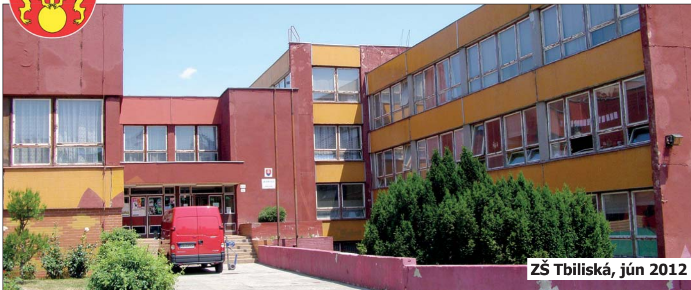
ZŠ Tbiliská, jún 2012