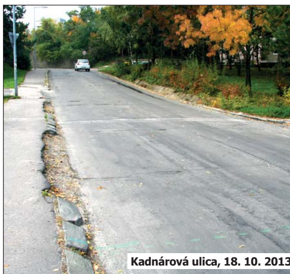
Kadnárová ulica, 18. 10. 2013

Výmena asfaltového povrchu vozovky v celej šírke na ulici Alstrova (v úseku od Stupavskej po Barónku), Piesková (od ul. Pri vinohradoch po Fongovú), Albánska (od Púchovskej po Kol'ajnú), prepojavací chodník medzi Kubačovou a Čachtickou pri pošte, Stupavská (v hornej časti + výmena odtokového žľabu).