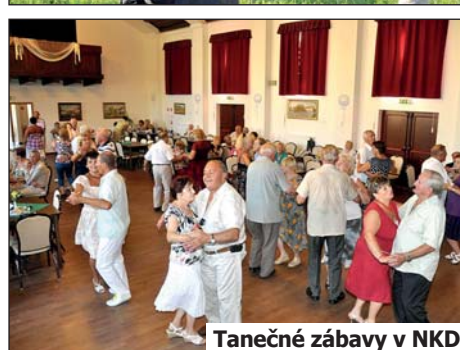
Tanečné zábavy v NKD