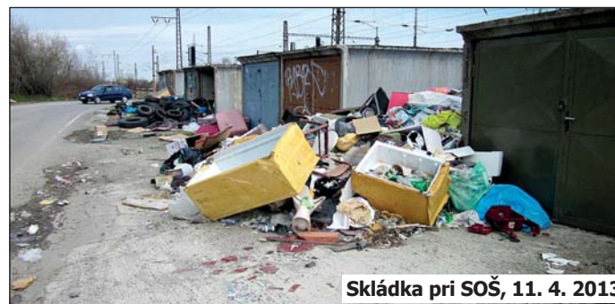
Skládka pri SOŠ, 11. 4. 2013

Zrekonštruované boli detské ihriská Plickova a Mudrochova a vypracovala sa štúdia na rekonštrukciu detského ihriska na Hubeného, ktorá bola v júli verejne prezentovaná občanom. Okrem toho sa vykonali zdravotné orezy stromov, na Mudrochovej ulici pri ihrisku boli osadené nové lavičky, vykonala sa tiež pravidelná výmena piesku v pieskoviskách.