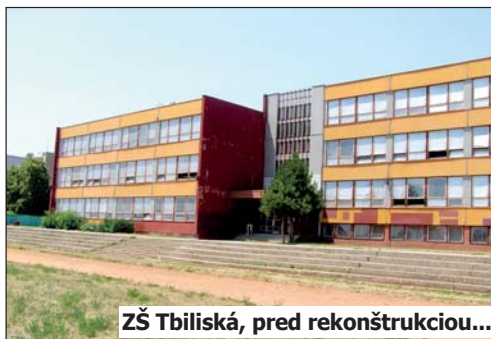
ZŠ Tbiliská, pred rekonštrukciou...

– zateplenie obvodového plášťa celého komplexu budov ZŠ, výmena okien a vstupných dverí, nová dlažba vstupov do školy, nové schodisko. Vybudoval sa bezbariérový vstup do školy s rampou pre imobilných. Osadený bol tiež aktívny bleskozvod a nainštalované boli dve školské kamery – pri hlavnom aj vedľajšom vchode. V kuchyni sa vyno-tili obklady a dlažba.