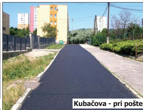
Kubačova - pri pošte