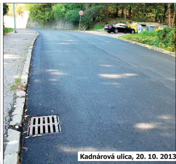
Kadnárová ulica, 20. 10. 2013