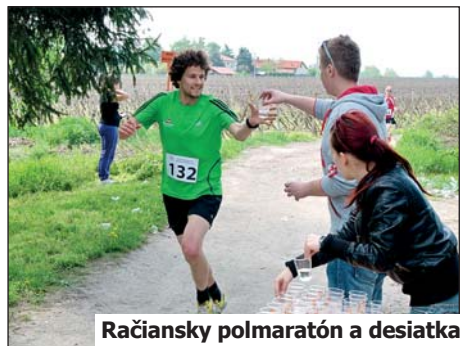
Račiansky polmaratón a desiatka