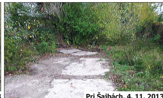
Pri Šajbách, 4. 11. 2013