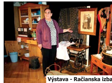
Výstava - Račianska izba