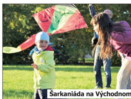
Šarkaniáda na Východnom