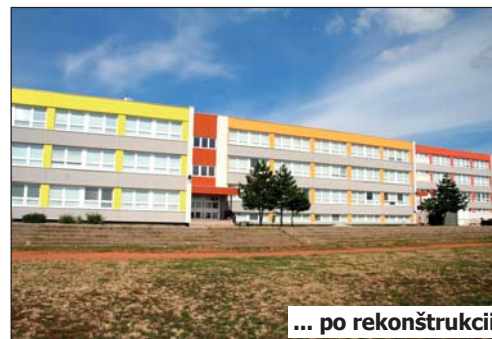
... po rekonštrukcii