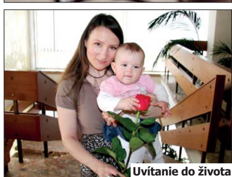
Uvítanie do života