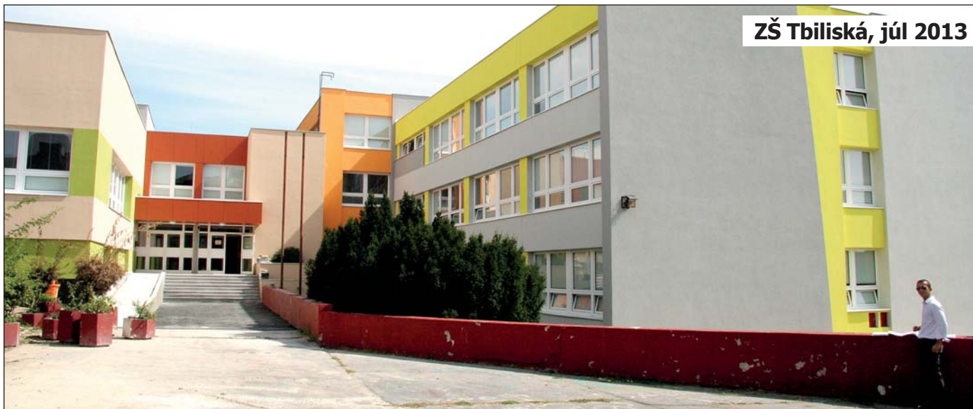
ZŠ Tbiliská, júl 2013