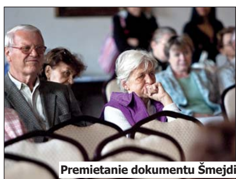
Premietanie dokumentu Šmejdi