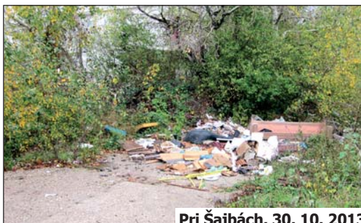
Pri Šajbách, 30. 10. 2013

Odstránených bolo spolu 10 čiernych skládok (napr. Pri lisovni, nad Peknou cestou, Pri šajbách, pri garážach na Černockého). Najväčšia a dlho problematická bola skládka za SOŠ Polygrafickou, kde sa v unimobunkách zdržiavali bezdomovci, dnes je skládka vyčistená.