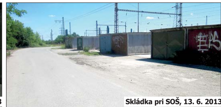
Skládka pri SOŠ, 13. 6. 2013