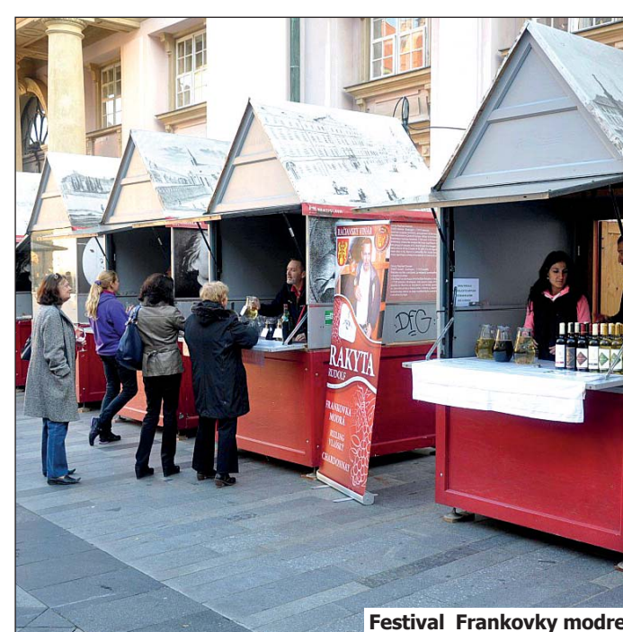
Festival Frankovky modrej

predvádzali ukážky lisovania hrozna, dotvorili príjemnú atmosféru Račianskych vianočných trhov v lisovni NKD, venovali svoje vína na rôzne reprezentačné akcie. Postarali sa o úrodu vína z Genofondu Frankovky modrej.