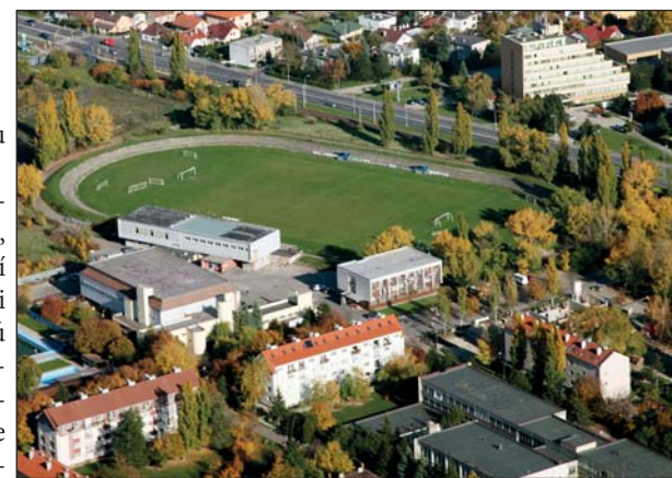
Mesto dá 30 000 eur na revitalizáciu areálu.