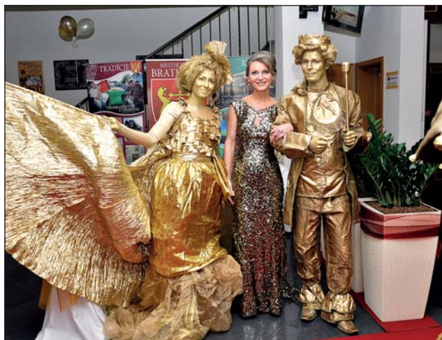
Atrakciou boli zlaté živé sochy.