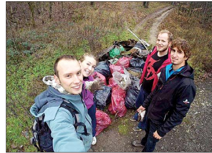
Štyria mladí dobrovoľne odstránili skládku.

Čo sa ukrývalo pri koreňoch stromov? „Stará keramika, nepori-