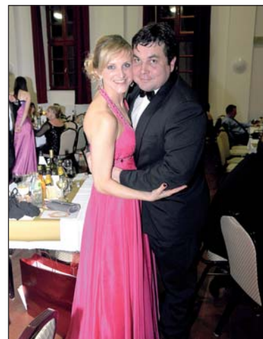
Hostia sa zabávali až do rána.