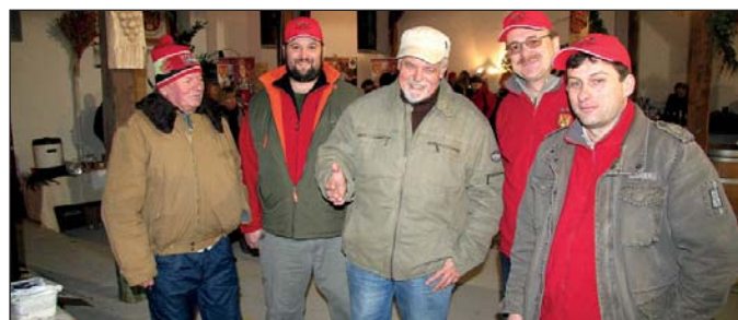
Pestrý program trhov zaujal návštevníkov všetkých vekových kategórií.