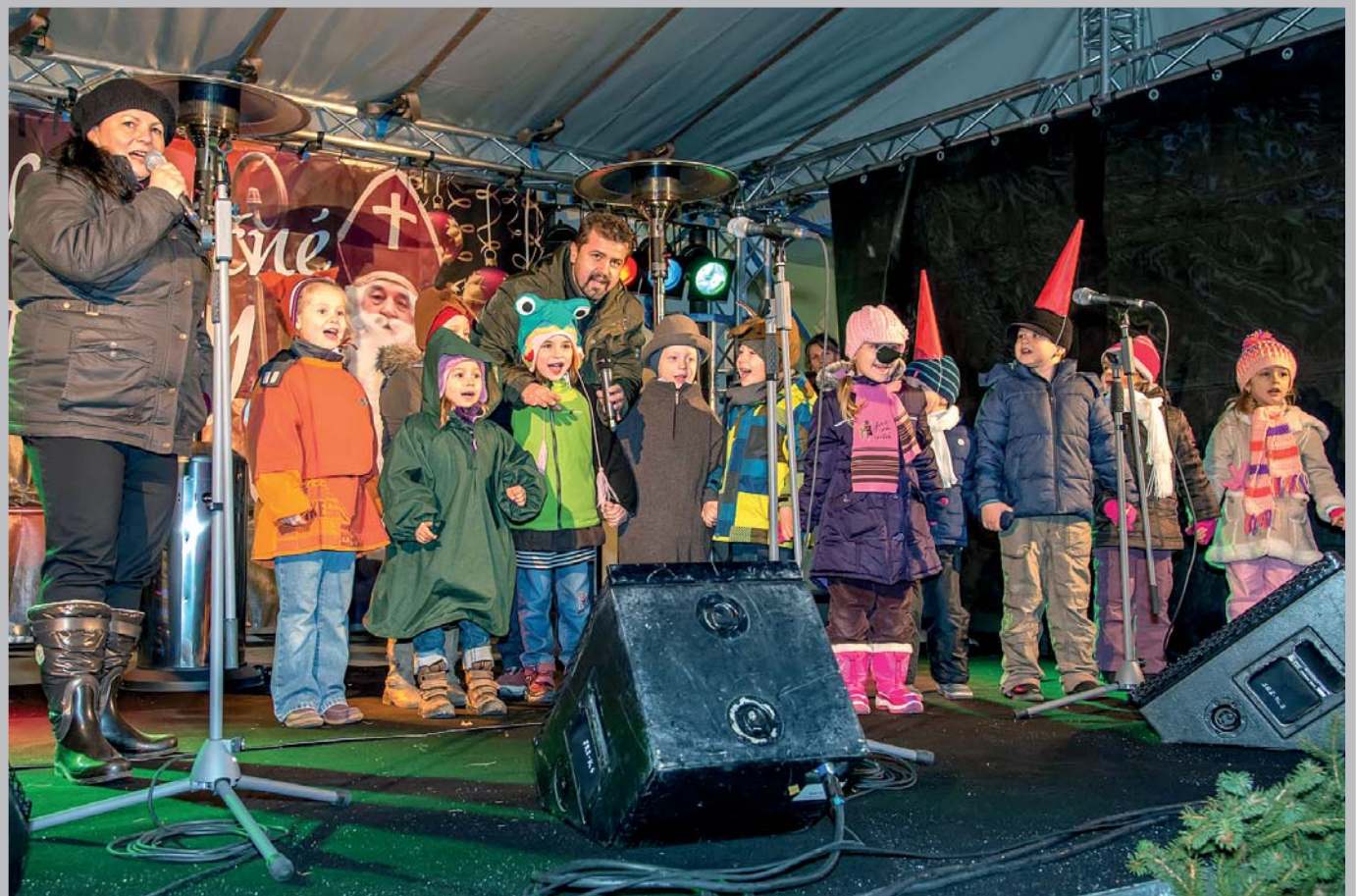
Tretí ročník račianskych vianočných trhov pred Nemeckým kultúrnym domom otvorili deti z materskej školy Barónka. Viac na strane 4.