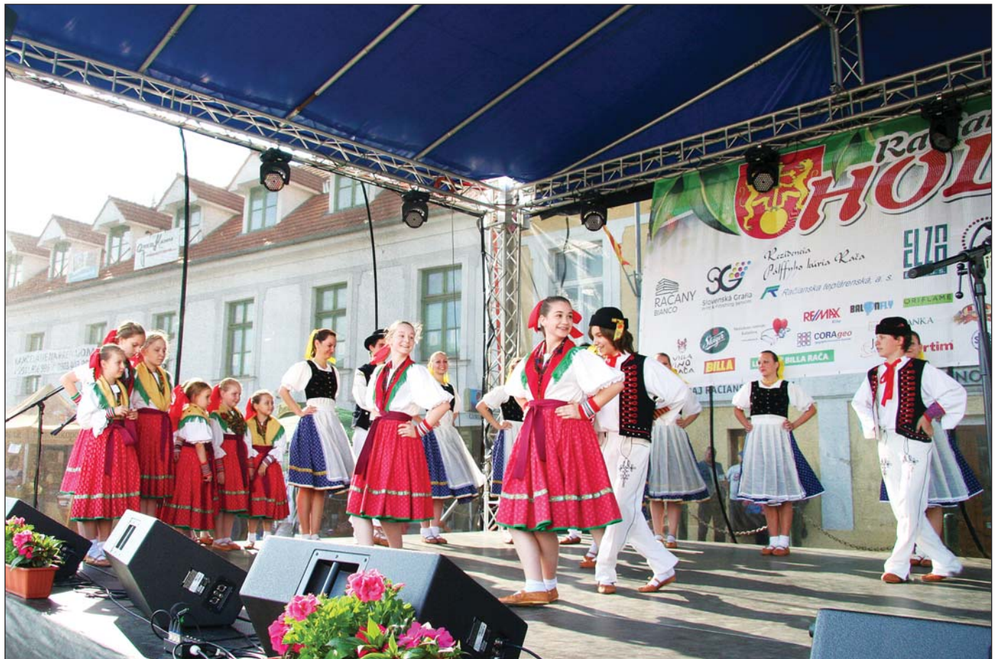
Det'ský folklórny súbor Studienka a Studnica spestrili program hodov 2012 na Námestí A. Hlinku.

Navštívte Račianske hody v dňoch 4. a 5. mája a pozrite si zaujímavý program. 7 - 10