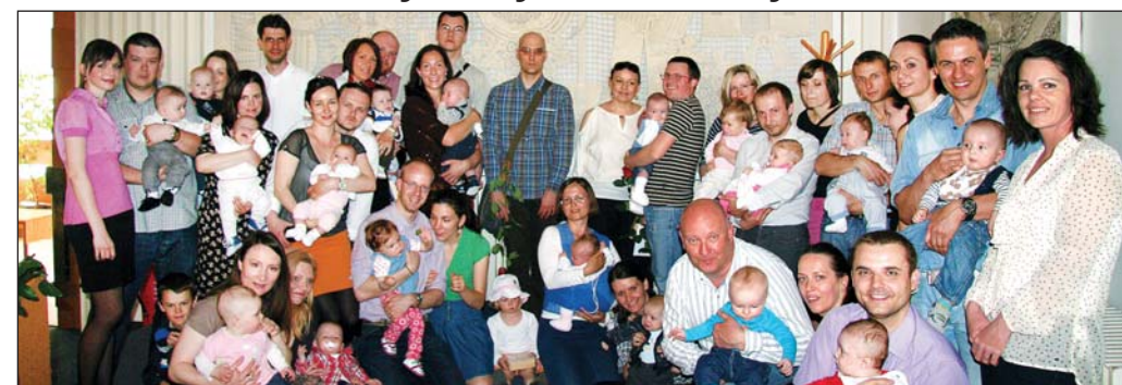
V stredu 24. apríla sa v sobášnej miestnosti stretli najmenší Račania.

Počas uplynulých šiestich mesiacov sa naša mestská časť rozrástla o 99 nových obyvateľov. Nemajú zuby, nosia plienky a nechajú sa nosiť na rukách. Napriek tomu ich v sobášnej sieni Rača privítala s očakávaním a veľkou radosťou. Prvýkrát v tomto roku sa tu totiž