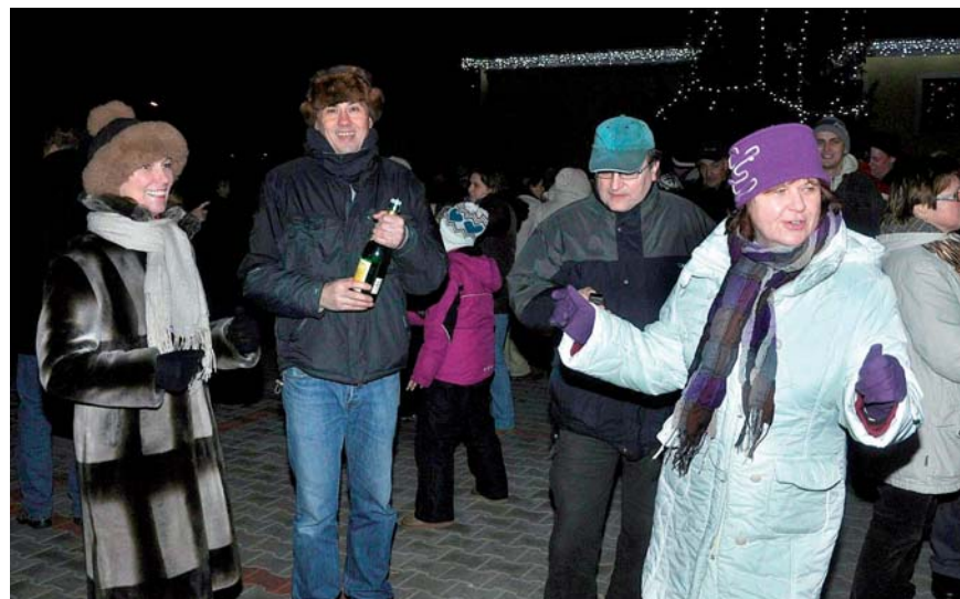
Račania sa výborne zabávali.