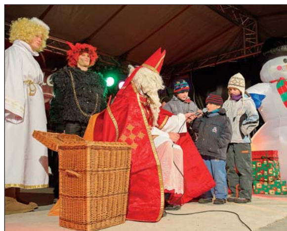
Trhy navštívil Mikuláš a deťom rozdal balíčky sladkostí.