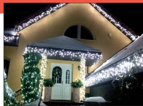
Dom Šortnerovcov z Potočnej ulice