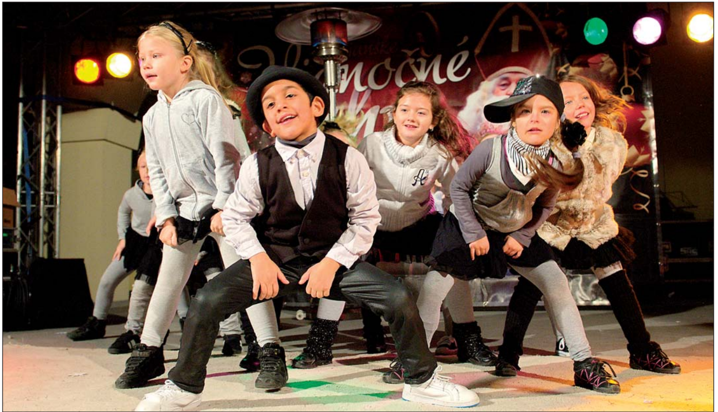
Kultúrny program račianskych trhov okrem iných spestrili aj deti z tanečnej skupiny H&T.

Prečítajte si termíny zápisov do ZŠ a MŠ v Rači, dôležité rady, aj novinky. 8 - 9