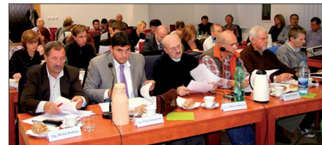
Poslanci MZ Bratislava - Rača

„Pozitívom je, že sa do rozpočtu podarilo zapracovať splátky úveru, ktorý si mestská časť vzala od banky v roku 2012, a z ktorého v súčasnosti čerpáme finančné