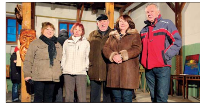
V priestoroch bývalej lisovne v Nemeckom kultúrnom dome vystavovali siedmi umelci z Rače.

Asi najznámejším domácim vystavovateľom bol maliar Voj-