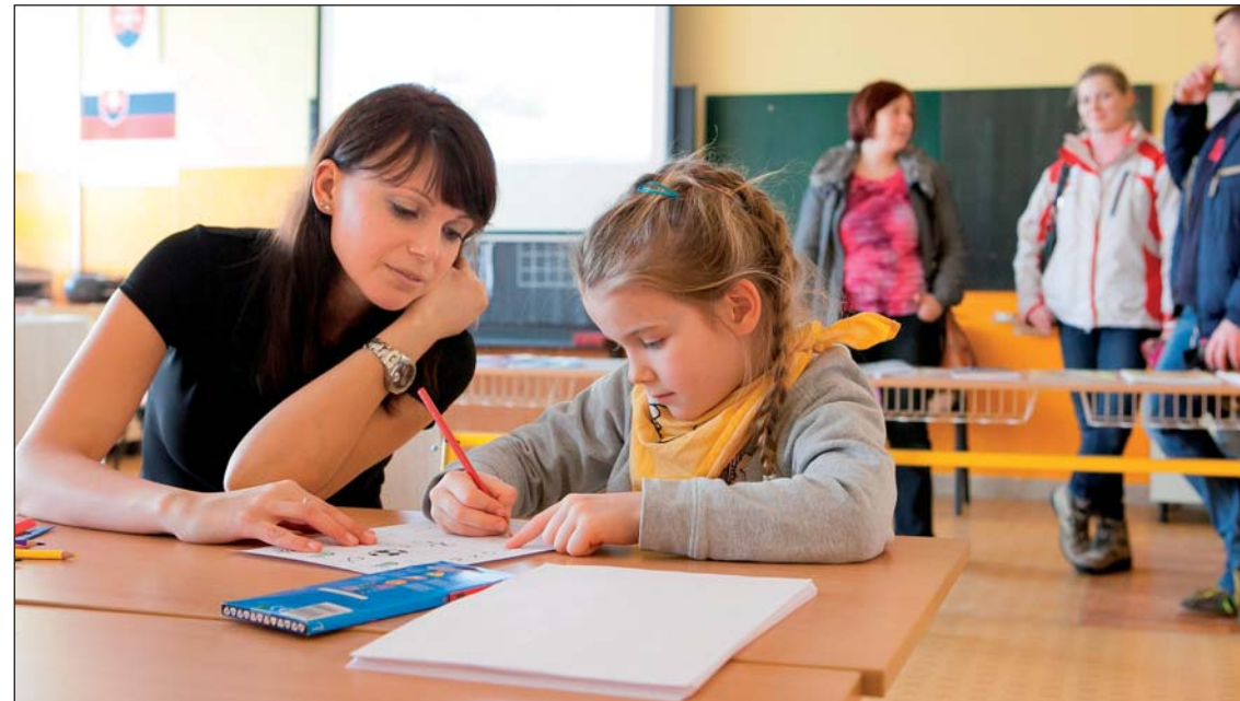
Počas zápisu sa bude každému dieťaťu venovať pani učiteľka osobitne a zistí jeho školskú zrelosť.

15. 2. – 15. 3. v čase od 6.30 do 17.00 hod.