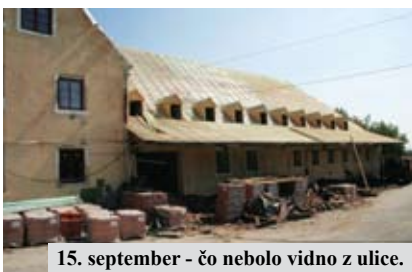
15. september - čo nebolo vidno z ulice.

Nemecký kultúrny dom – objekt zapísaný v Zozname evidovaných pamätihodností mestskej časti Bratislava-Rača. Tento objekt postavili v štyridsiatych rokoch minulého storočia nemeckí Račania. V roku 1948 bol znárodný, čím sa odstránil dlhoročný problém – o historický dom sa staral štát. Od roku 1988 bol však tento objekt nefunkčný, jednoducho chátral. Medzi najdôležitejšie úlohy schválené MZ Bratislava - Rača patrí jeho rekonštrukcia, oprava a sfunkčnenie. V roku 2009 objekt pútal na seba veľkú pozornosť