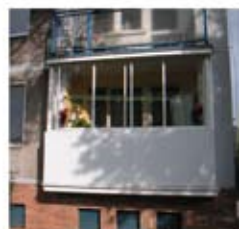
švédsky rámový systém