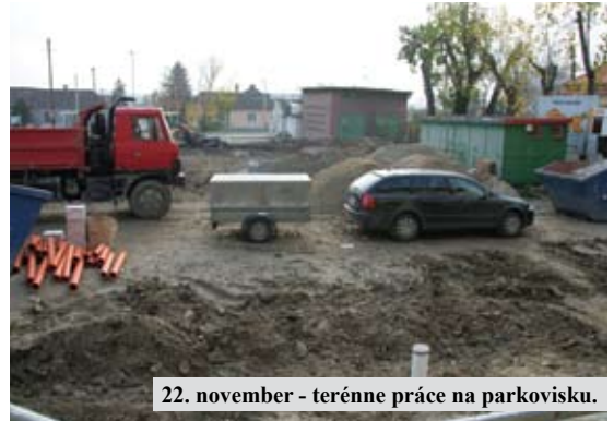
22. november - terénne práce na parkovisku.