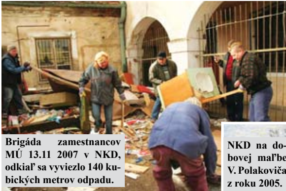
Brigáda zamestnancov MÚ 13.11 2007 v NKD, odkiaľ sa vyviezlo 140 kubických metrov odpadu.