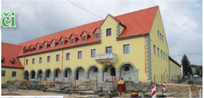
17. október - objekt sa postupne pripája na inžinierske siete.