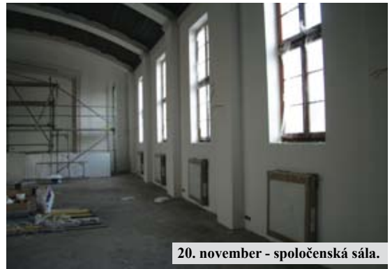
20. november - spoločenská sála.