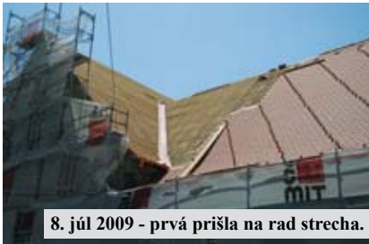
8. júl 2009 - prvá prišla na rad strecha.