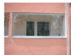
fínsky otočný systém

informácie na tel.: 02/2079 3771, 0907 893 771