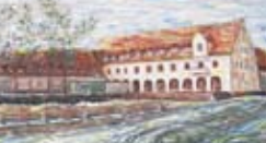
NKD na dobovej maľbe V. Polakoviča z roku 2005.