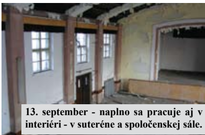
13. september - naplno sa pracuje aj v interiéri - v suteréne a spoločenskej sále.