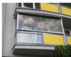
švédsky bezrámový systém