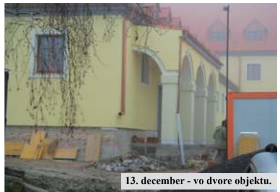
13. december - vo dvore objektu.