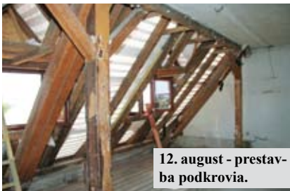
12. august - prestavba podkrovia.