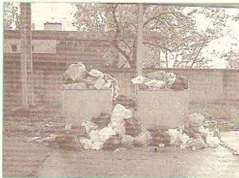
Východné – kontajnery pred 120-bytovkou (k článku Klieťka hanby)

Priatelia, ak by sme si zacementovali v stroji času do histórie stredoveku, stretli by sme sa tam, dnes už pre nás viac ako originálnym riešením uplatňovania práva trestu, a to s „kľetkou hanby“. Dievčatá nevalnej povesti, zloději, vandali, vyvrheli, proste všetci tí, ktorí sa previnili a podľa miery priestupku, činu spĺňali kritériá, aby ich vtedajšie zákony uväznili do kľetky hanby, kde ich aj spoluobčania mohli morálne odsúdiť, za nie zrovna vydarené osobné charakterové vlastnosti. História odvtedy už prebehla solídne kilometre času, zákony sa prispôbili danej dobe, ale vo mne často prebehne predstava obrazu pomyselnej „kľetky hanby“, do ktorej by na základe svojich skutkov, činov patrili jedinci, skupiny, podnikateľské subjekty, štátne organizácie atď. Veď mnohí z nich sa beztrešne, chrapúnky smejú slušným ľuďom do tváre, ba neváhajú sa vyhrážať, vediac že zákon je často na nich krátky a keď náhodou sa niekto odváži dodržať literu zákona, dnes všemocné peniaze zahľadajú aj nemožné. Šoféri s luxusnými veľkými autami parkujúci na zelených trávnikoch, grafiti, tzv. veľkí umelci poškodzujúci svojimi výtvarmi budovy, zastávky, vandali demoluujúci všetko od smetných košov po zastávky atď., jedinci, organizácie, ktoré bez štipky svedomia sypú do domových kontajnerov a vedľa nich odpad, ktorý patrí do veľkoplošných kontajnerov, ktoré si majú skupinovo alebo sami objednať, namiesto toho lieta nadvoko uložený odpad po celom sídlisku, hoci títo