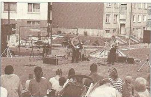
Skupina „Šijací stroj“ uvádza spomienkové pásmo od Beatles po Queen so súťažami a populárnymi piesňami 60 – 80-tych rokov.

Nad Račou nebolo zatmenie slnka úplné, ale i tak sa zjavne na pár minút zošerilo. Pohľady mnohých sa však upierali hore. Hoci nie je hviezdársky, dával sa i náš fotoaparát a zvečnil tento úkaz nad Račou i pre vás.