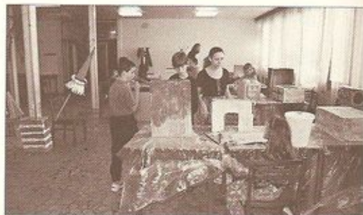
Takto si deti svoje masky vyrábali. Na fotografii vľavo sú deti v sprievode masiek – ukázali svoje veľdiela na schodišti KS Račan aj pred objektívom redakčného fotoaparátu.