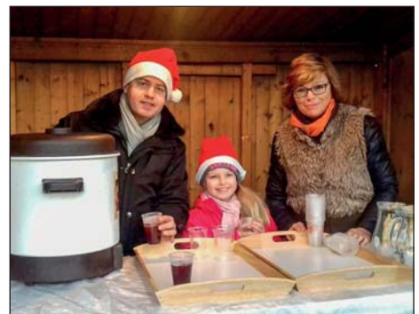
ači, foto Miroslav Hájek Starosta Rače ponúkal punč.

Všetkým poslušným deťom priniesol Mikuláš sladké balíčky. V Červenej lisovni sa rozložili miestni vinári s bohatým výberom rôznych odrôd a chuti. Na miestnom úrade prebehla výstava prác detí račianskych materských škôl, ktoré nakreslili vianočný stromček. Ten skutočný, živý aj a vysvietený mali tak ako vlni všetky tri časti Rače.