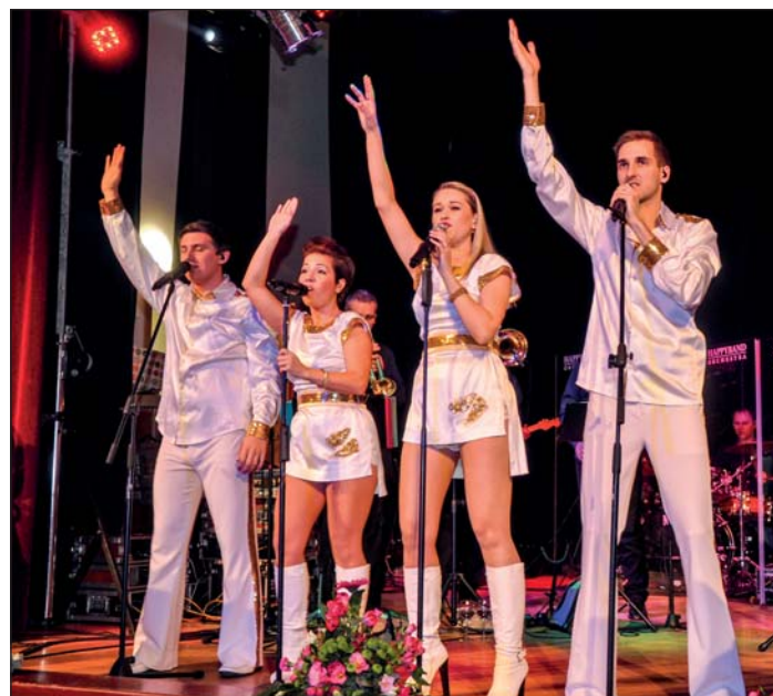
Kapelu HAPPYBAND ORCHESTRA a vystúpenie ABBA SHOW si užili všetci hostia.