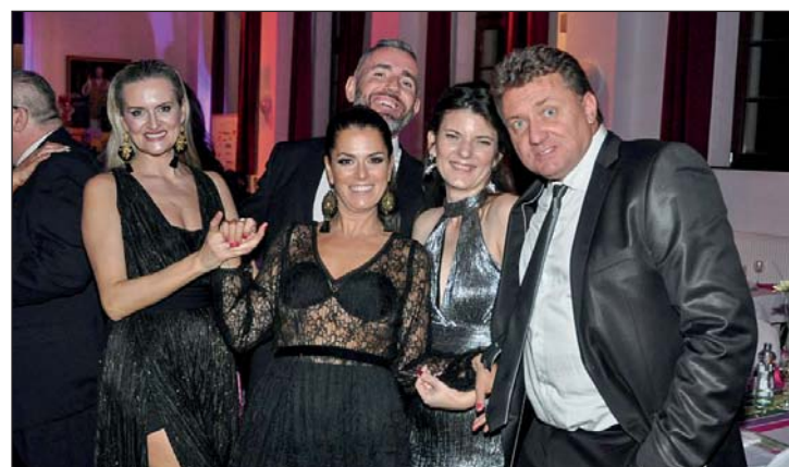
Prijemná atmosféra sa prejavila aj na úsmevoch hostí.