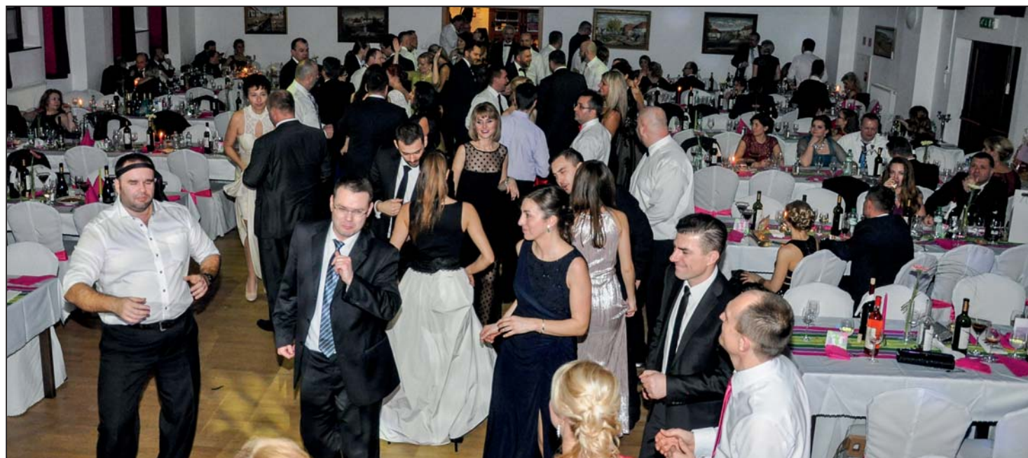
Plesová sála hýrila zábavou aj farbami.