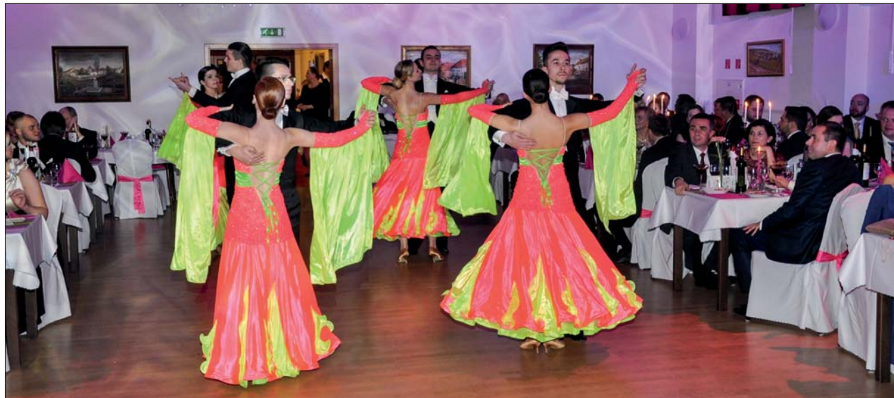
Večer spestrili profesionálni tanečníci z Interklubu Bratislava.