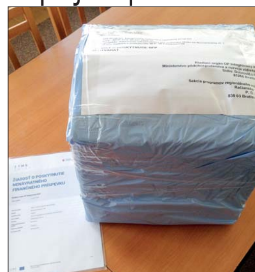
Projekt budúcej škôlky

V najbližších týždňoch bude prebiehať hod-