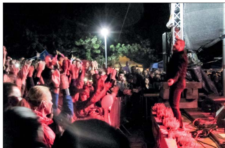
Skupina Desmod roztleskala celý amfiteáter.