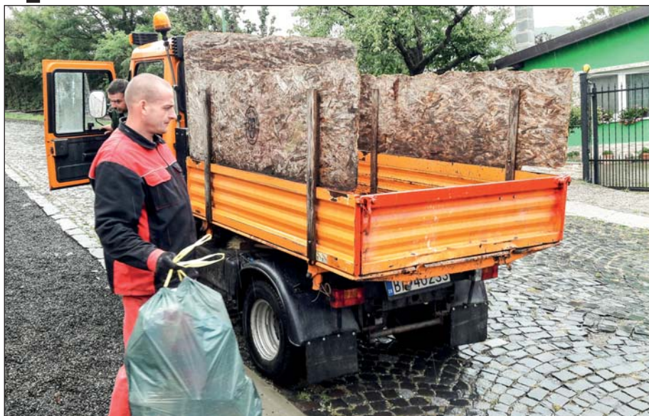
Najbližšie termíny odvozu plastu a papiera sú 17.10., 31.10. a 14.11

3. Uvedte meno, adresu trvalého alebo prechodného pobytu, tiež adresu, odkiaľ sa bude plast a papier odvážať a svoje telefónne číslo. Službu je možné si objednať na pravidelnej báze, napríklad každé dva týždne alebo raz do mesiaca, dá sa však objednať aj jednorazovo.