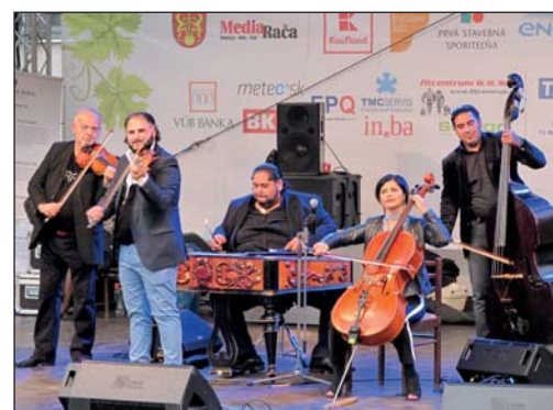
Cigánski diabli ukázali svoje umenie.