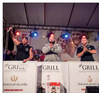
Víťazi súťaže Strongman show