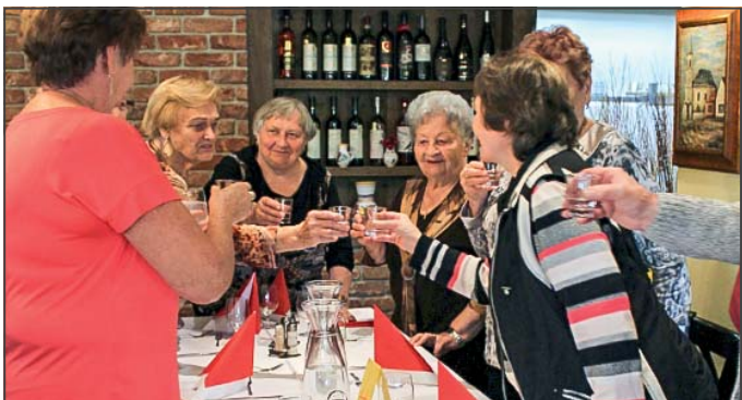
Slávnostný prípitok na zdravie všetkým seniorom

Október je mesiac venovaný starším ľuďom a ako vďaka za ich ťažký život im prejavujeme patričnú úctu. V Rači sa pri tejto príležitosti organizovalo viacero osláv. Úžasný koncert skupiny AKCENT LIVE a vystúpenie Dua Mírka a Ondrej si užili v Nemeckom kultúrnom dome, seniorom na Rendez prišli zarecitolovať a zaspievali detičky z MŠ pri Šajbách, v Krasňanskej be-