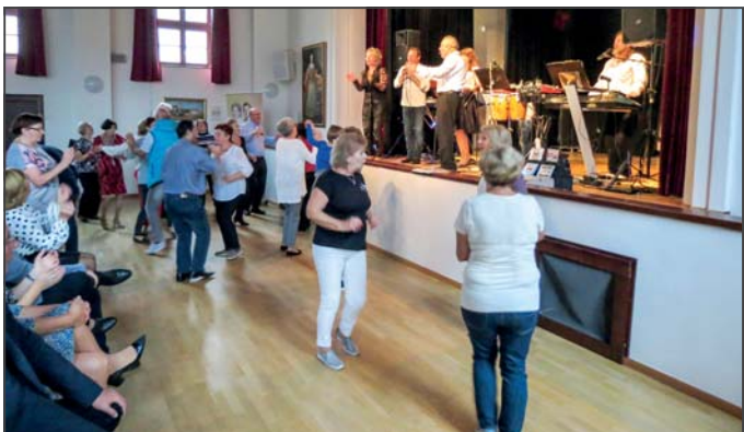
Seniori si v NKD zaspievali aj zatancovali.