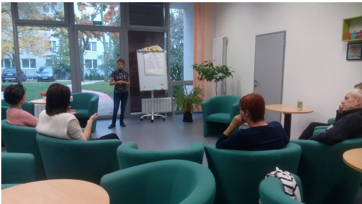
foto – supervízia

Ako respondenti sme sa zúčastnili výskumu na tému - deinštitucionalizácia sociálnych služieb, ktorý realizovalo Centrum pre výskum etnicity a kultúry (CVEK).