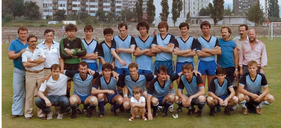
Lokomotíva Rača – víťaz Majstrovstiev kraja 1985/86 pred juniormi Slovana Bratislava a Interu Bratislava