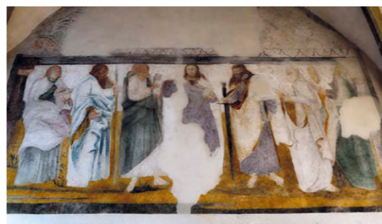
Fresky vo farskom kostole