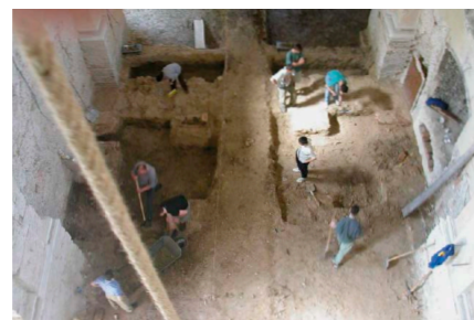
Rok 2003 - archeologický prieskum

„Veľký zvon, ktorý sa pukol, musel byť preliaty. Vysvätený bol 19. novembra 1863 u alžbetínok, skrze osv. biskupa a prešporského prepošta Jozefa Vébera, ku cti sv. apoštolov Filipa a Jakuba. Zvon sám je ťažký 12 centov a 84 kg. Do mestečka (Réča/Récze) bol so slávnosťou dovezený večer a 20. novembra na svoje miesto usa-